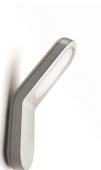
Réf. 16910/87/16 applique murale (prix conseillé : 139,95 €)

La Seabreeze est disponible en version poteau et applique murale. Elle se décline en gris et en anthracite.