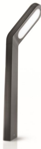
Réf. 16908/93/16 modèle sur pied (prix conseillé : 189,95 €)