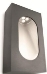
Réf.16816/93/16 applique murale