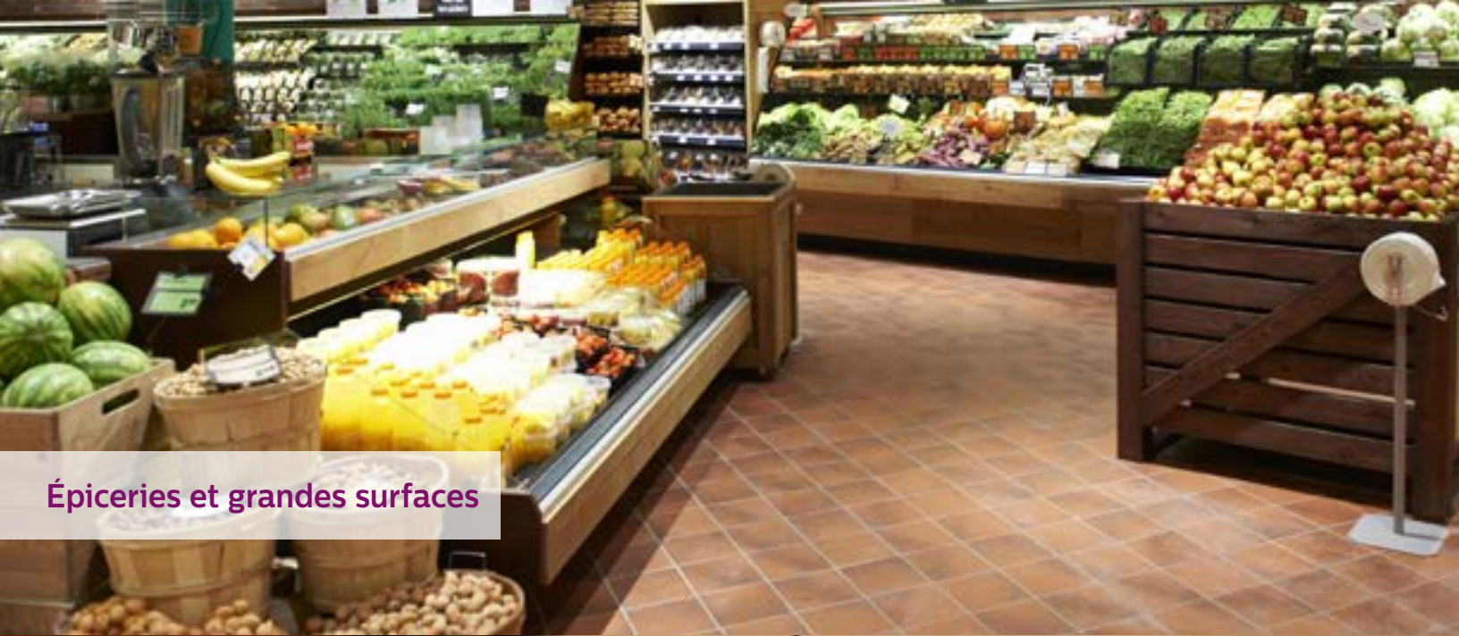
Épiceries et grandes surfaces