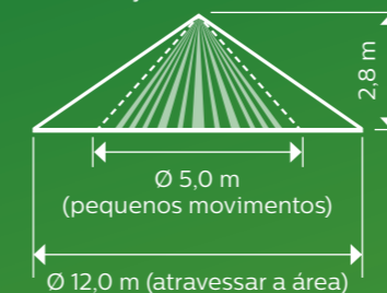
Diagrama de cobertura de deteção