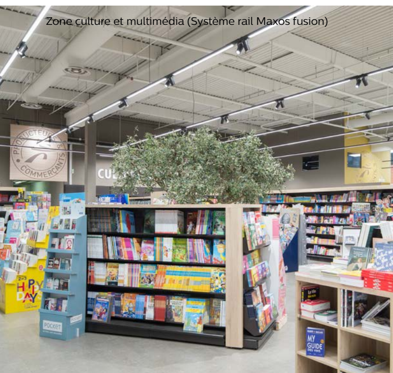
Zone culture et multimédia (Système rail Maxos fusion)

Tout d'abord, cela participe pleinement à l'image de l'enseigne et du magasin. C'est un élément clé de la modernisation du point de vente qui permet la mise en valeur des produits et des compétences. Nous sommes passés d'un éclairage uniforme à un éclairage attractif dédié à chaque univers. Le confort de nos clients a été fortement amélioré avec une augmentation de la valeur du panier moyen.