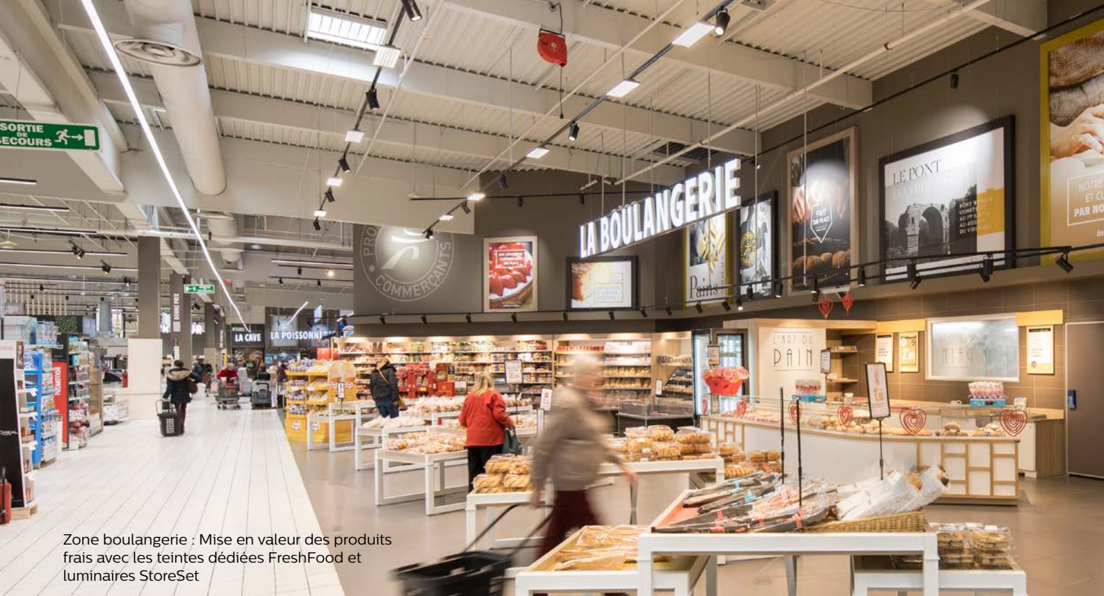
Zone boulangerie : Mise en valeur des produits frais avec les teintes dédiées FreshFood et luminaires StoreSet