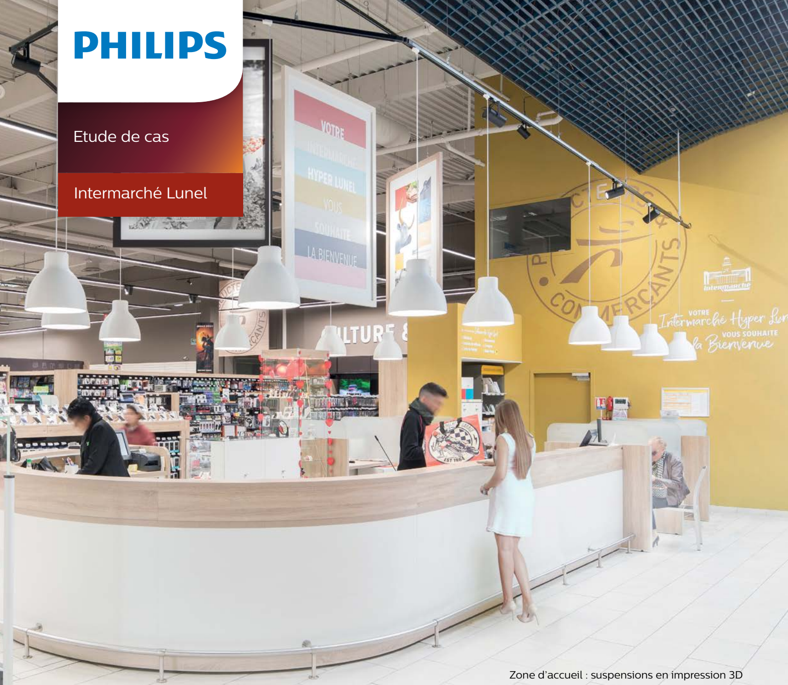
Zone d'accueil : suspensions en impression 3D