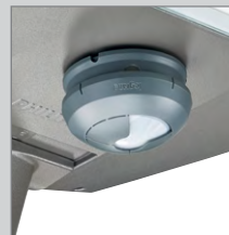
WattStopper (solution SR)