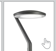
CitySoul gen2 LED