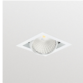
GreenSpace Accent Gridlight GD301B luminaire