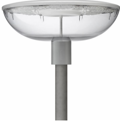
TOWNGUIDE PERF BOWL - LED GreenLine 2500 lm