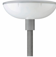
TownGuide Performer BDP101 Fußwegleuchte mit mattierter Wanne