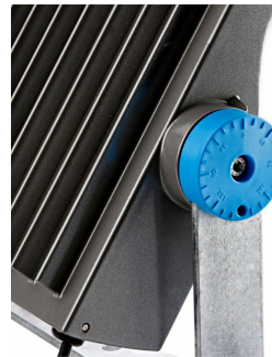
ClearFlood Vista lateral