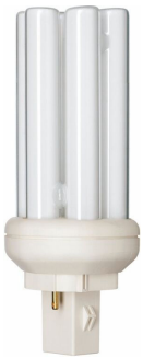
LPPR PLT2PN 18W