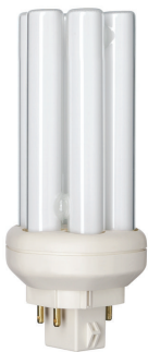
18W, GX24q-2, 4P