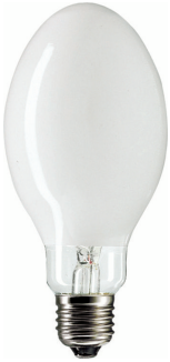
LPPR SON-H E27