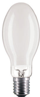
MASTER SON PIA Plus E40