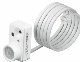
LRI1663/00 ActiLume gen2 Multi-Sensor