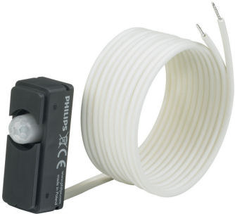
LRM8140/00 ActiLume G2 RF Mov Sensor