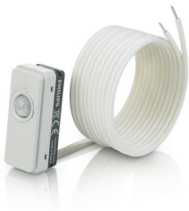
LRM8119/00 Lum Based Ext Sensor with LCA8004/00 COVER