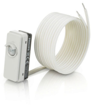
LRM8119/00 Lum Based Ext Sensor with LCA8004/00 COVER