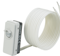
LRM8119/00 Lum Based Ext Sensor with LCA8004/00 COVER