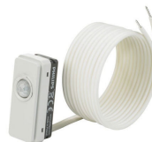
LRM8119/00 Lum Based Ext Sensor with LCA8004/00 COVER