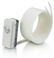
LRM8119/00 Lum Based Ext Sensor with LCA8004/00 COVER