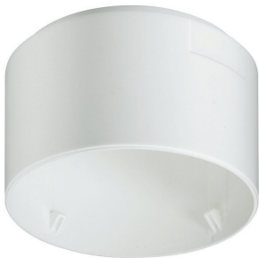
LRH2070/00 SURFACE BOX