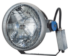
PowerVision MVF403 svĕtlomet pro sportovištĕ