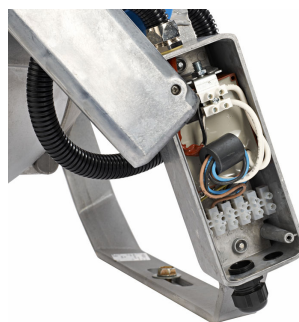
Boîtier de connexion électrique équipé d'un amorceur électronique, version électronique Flicker-Free