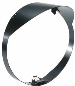
ARENAVISION Ordercode 23999600