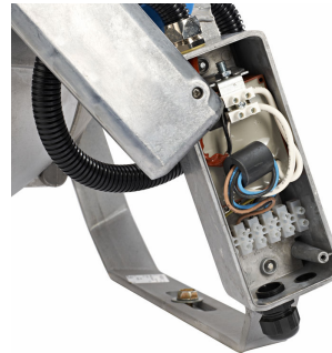
Boîtier de connexion électrique équipé d'un amorçeur électronique, version électronique Flicker-Free