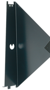
Simple aiming device