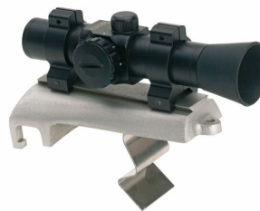
Zařízení pro přesné zaměření Ordercode 89695000