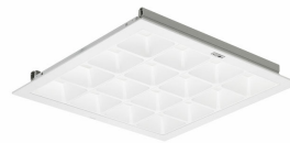
Luminaire LED encastré PowerBalance gen2 RC460B/ RC461B avec ActiLume (version pour plafond à profil visible)