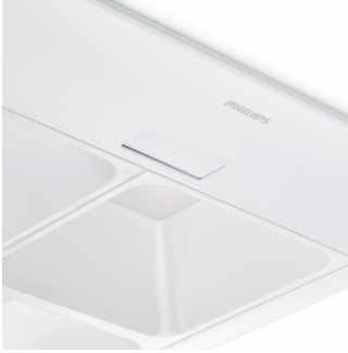
Fentes pour les capteurs choisis