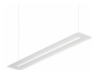
SmartBalance Suspended Mounted - LED Module, system flux 3500 lm