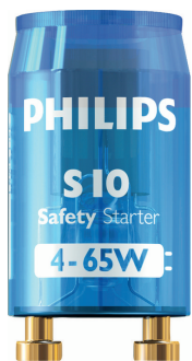
LPPR STARTER PHL 0003