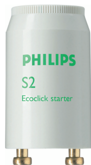
LPPR STARTER PHL 0004