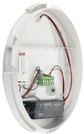
CoreLine_Wall-mounted- WL131V_D35_CTO_PSR_MDU- DPP.TIF