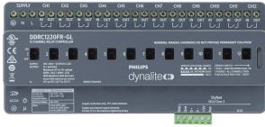
Front of the DDRC1220FR-GL 12 x 20A Relay Controller