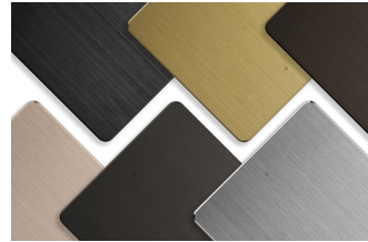
AntumbraButton - Different colors Button Finish