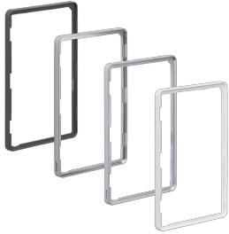
Different RIM colors EU