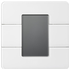
PADPE AntumbraDisplay EU White - Front