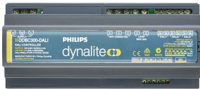
DDBC300-DALI 3 x DALI Driver Controller front