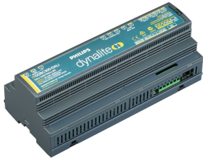
DDBC300-DALI 3 x DALI Driver Controller