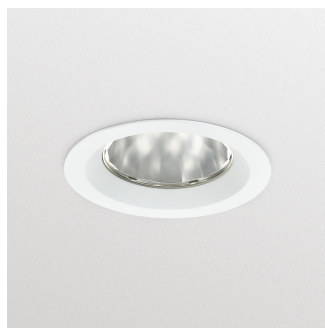
GreenSpace Accent Fixed