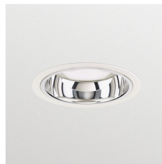
LuxSpace2 Mini Low height recessed - LED Module, system flux 1200 lm - 830 - Blanco