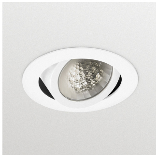
LuxSpace Accent Compact G3 - LED Module, system flux 1700 lm