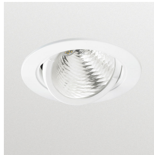
LuxSpace Accent Performance G3 - LED Module, system flux 2700 lm