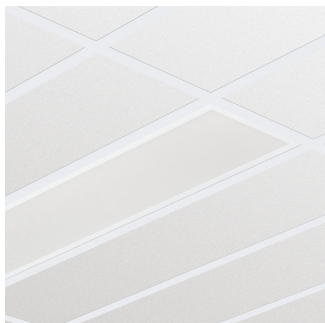
SlimBlend recessed mod. 600