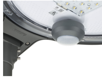
TownTune ASY BDP265