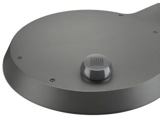
TownTune ASY BDP265