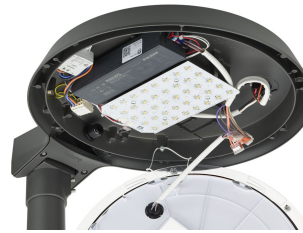
TownTune ASY BDP265