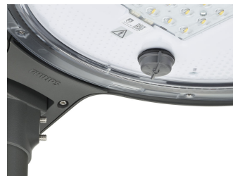
TownTune ASY BDP265