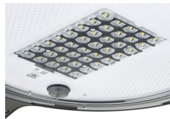
TownTune ASY BDP265