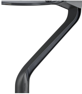
TownTune LYR BDP270