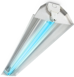
TMS030 UV-C batten