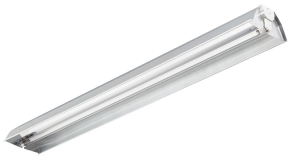
TMS030 UV-C batten