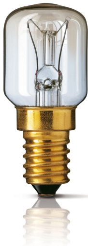
Lampe tubulaire claire