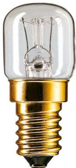
Lampe à incandescence tubulaire