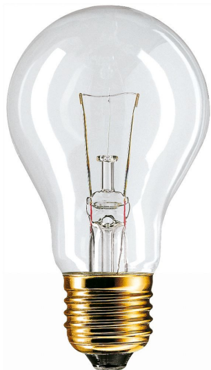
Lampe claire pour tensions 24V