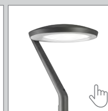
CitySoul gen2 LED