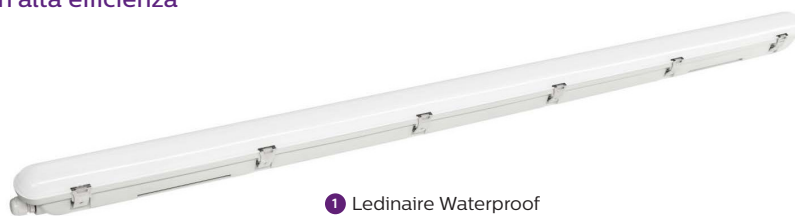
1 Ledinaire Waterproof WT065C G2