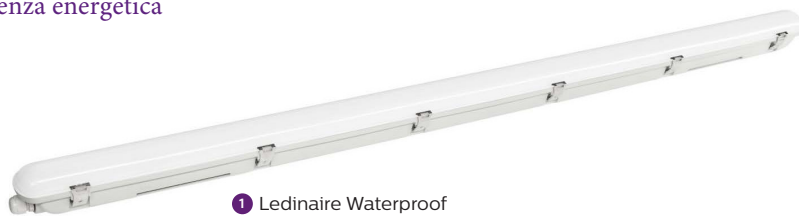
1 Ledinaire Waterproof WT065C G2