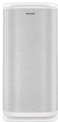
「フィリップス UV-C 室内空気除菌器 コンパクト」

コロナ禍における家庭内感染を防ぐための一助として、本製品は一般消費者のニーズにお応えしてまいります。