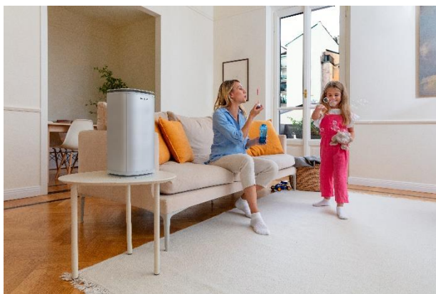
製品使用イメージ

UV-C 室内空気除菌器 コンパクト動画 URL https://youtu.be/bN6UUrFQf9Q