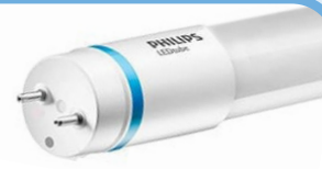
EM/Mains T8 1x blauwe ring