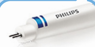
InstantFit HF T5 2x blauwe ring