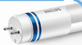
InstantFit HF T8 2x blauwe ring