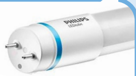
EM/Mains T8 1x blauwe ring