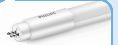
Mains T5 geen ring