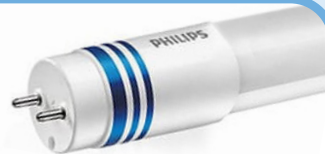
Universal T8 3x blauwe ring