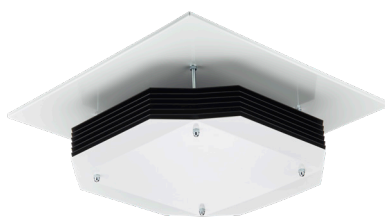
SM345C 4 x 9 W