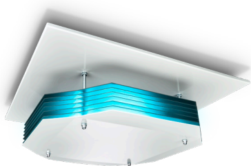
SM345C 4 x 9 W