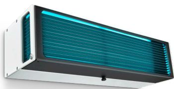
WL345W 1 x 25 W