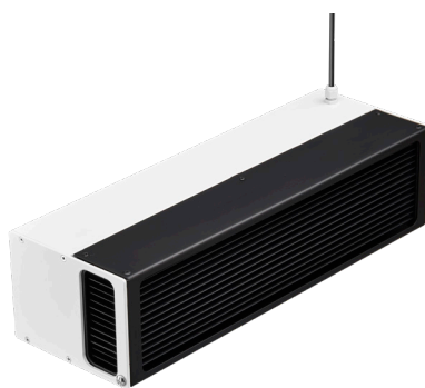
WL345W 1 x 25 W