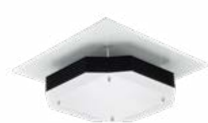
SM345C 4x 9 W