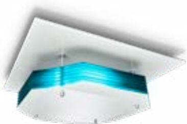
SM345C 4x 9 W