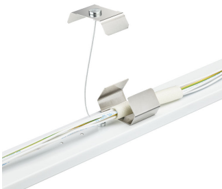
Maxos universal panel springs