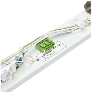
Maxos universal panel phase selector