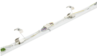
Maxos universal panel Through wiring