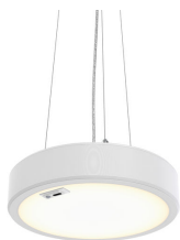
Essential Suspended RTP