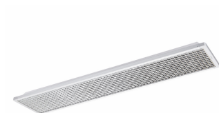
School Lighting SP