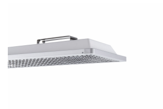
School Lighting SP