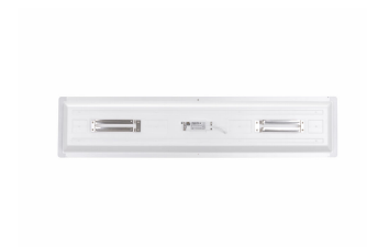
School Lighting SP