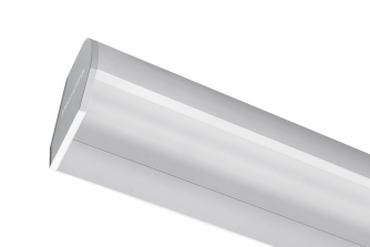
School Lighting SP