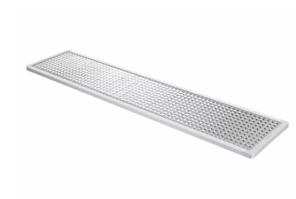
School Lighting SP