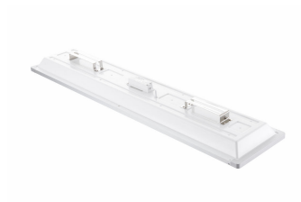
School Lighting SP