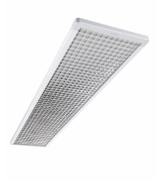
School Lighting SP