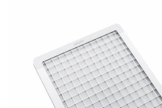
School Lighting SP