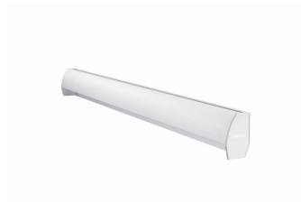
School Lighting SP