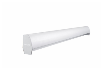
School Lighting SP