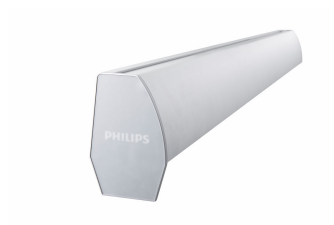
School Lighting SP