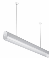
School Lighting SP