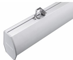
School Lighting SP