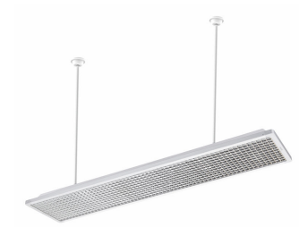
School Lighting SP