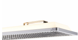
School Lighting SP