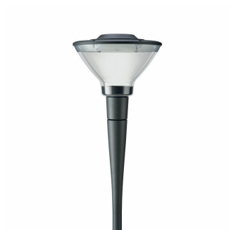
OPPr BDS490i 0009