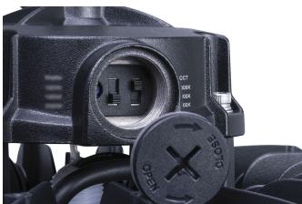
Ledinaire BY030P CCT swtch DDP3