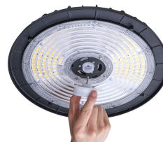
Ledinaire BY030P sensor install DPP