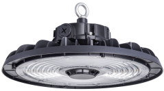
Ledinaire Highbay All-in BY30P