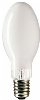
LPPR CDO-ET E40