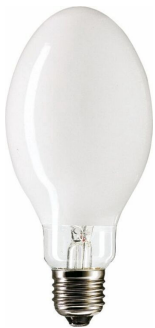
LPPR CDO-ET E27