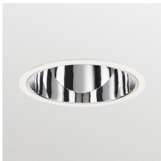
IPPR DN570Bi 0015