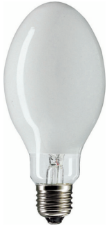
LPPR SON-I CO