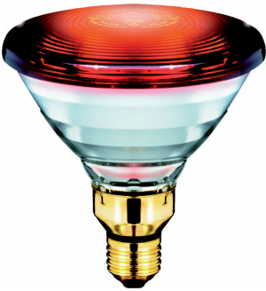
LPPR IRINPHI E27 PAR38